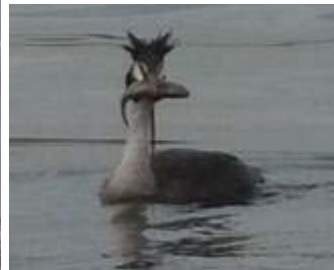
Une parade nuptiale de grèbes huppés au pied de Grigny 2 !